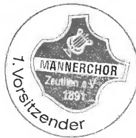
Gez. A. Rietz

Die zu beantragende Fördersumme beträgt 950,00 €.